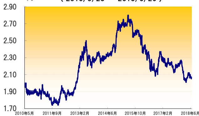
フィリピン・ペソ（対円）レートの推移 (2010/5/28 ~ 2018/6/29)