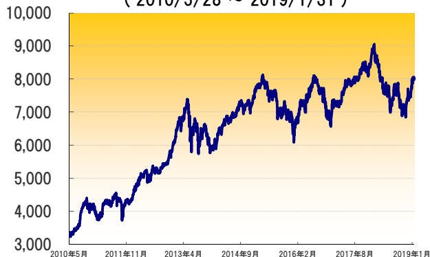
フィリピン総合指数の推移 (2010/5/28 ~ 2019/1/31)