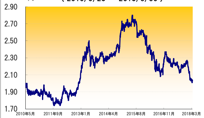
フィリピン・ペソ（対円）レートの推移 (2010/5/28 ~ 2018/3/30)