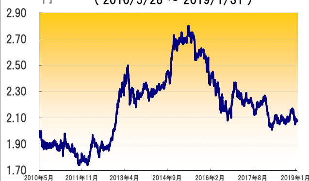
フィリピン・ペソ（対円）レートの推移 (2010/5/28 ~ 2019/1/31)