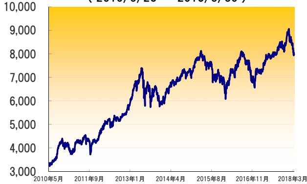
フィリピン総合指数の推移 (2010/5/28 ~ 2018/3/30)