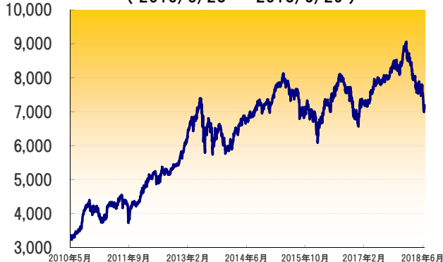
フィリピン総合指数の推移 (2010/5/28 ~ 2018/6/29)